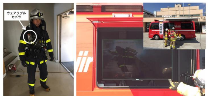
図 2. 隊員ウェアラブルカメラと伝送映像

DENGYO の「FalconWAVE-MP」は、広域のアクセスポイント Wi-Fi 機能を内蔵した無線 LAN システムです。一方のカメラは Wi-Fi で映像伝送するウェアラブルカメラが進歩しており、