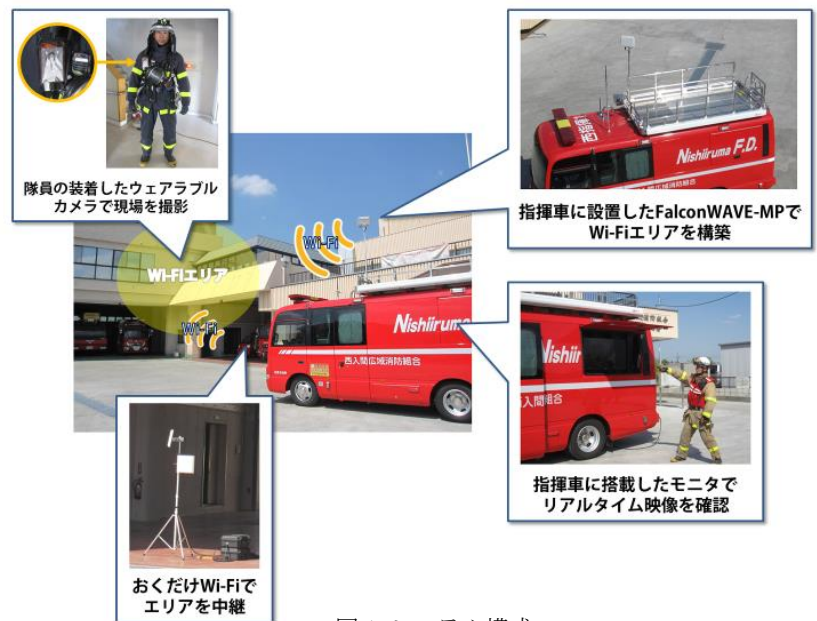
図 1. システム構成

そのためには、前線で活動する消防隊員が見る視点をリアルタイムで指揮隊に映像伝送することが必要となります。この映像伝送は無線で可動的に伝送することが望まれていました。