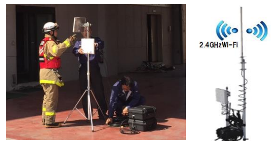
図 4. おくだけ Wi-Fi

無線エリアは予期していない障害物により不感地が発生することがあります。この場合に、おくだけ Wi-Fi を使えば、FalconWAVE-MP の Wi-Fi 電波を中継し、不感地を Wi-Fi エリアに構成することが可能になります。