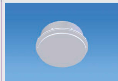
シーリングライトアンテナ