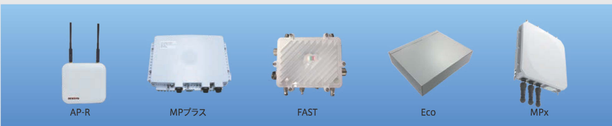
マルチメディア無線伝送システム FalconWAVE® シリーズ