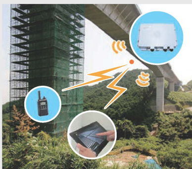
現場のIoTソリューション 広域無線LAN