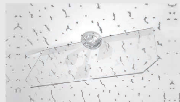
5G対応視光透過(透明)アンテナ