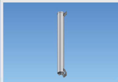
5G対応マクロセル用基地局アンテナ