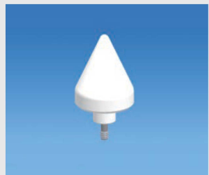
携帯電話基地局用GPSアンテナ