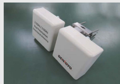
5G対応スモールセル用4MIMOアンテナ