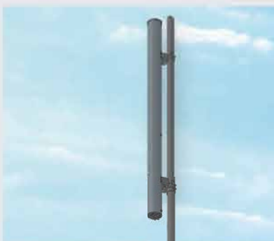
5G対応携帯電話基地局用多周波共用アンテナ