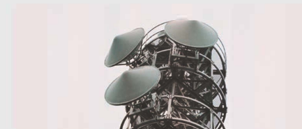
放送中継局用パラボラアンテナ